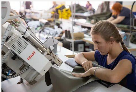
Технолог промышленного производства